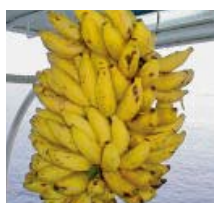
フルーツ食べ放題